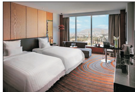
Pullman Vung Tau Hotel

古芝地道、戰爭博物館、湄公河三角洲、熱帶水果園、耶穌山、鯨魚廟、Vincom Center、歷史博物館、3D視覺美術館、統一宮