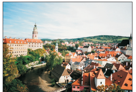
古姆洛夫城(自費參加)

·「 古姆洛夫古城 」：可由領隊代安排自費前往伏爾他河S型的河灣，將古城分為城堡區、下游區及舊城區。舊城區內之聖維塔教堂和市政廣場及清幽的散步路線，充滿中世紀古典優雅的情調。