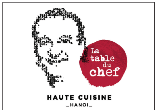
米芝蓮二星廚師推介～Press Club