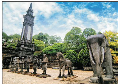
世界文化遺產～順化皇城