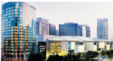
金融街麗思卡爾頓酒店