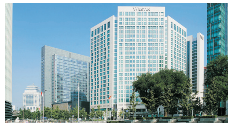
金融街威斯汀大酒店