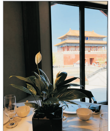
四季民福餐廳(欣賞故宮角樓風景)

屬京幫菜，是以北方醬、燉為基礎再改良而成的特色北京菜。大魚頭鹹鮮微辣，肉質嫩滑而香味濃郁，佐以酥脆的烙餅，現烙現吃，蘸湯享用更加可口，一菜兩食。