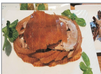
四季民福酥香嫩烤鴨