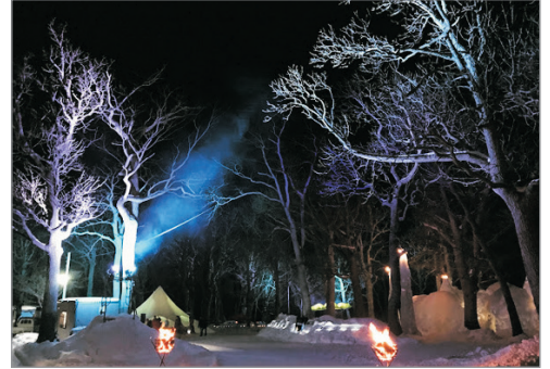
知床流冰祭(自行參與)(註5) (2020年1月30日至2月29日期間舉行)

Day 7 北廣島三井Outlet Park#—札幌→香港 # 2020年1月30日至2月5日出發，改為前往【第71回札幌雪祭】。