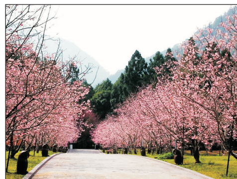
《季節限定》九族櫻花祭(註1)