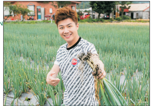
下田拔蔥+蔥油餅DIY體驗