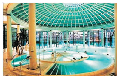
「寫意溫泉樂」 包入場享受巴登巴登 Caracalla Spa健康溫泉

佔地5600平方米的展區中陳列著超過80輛不同型號車款，由1900年打造的世界第一款混合動力車～傳奇車型，直到最新一代的保時捷。博物館以“車輪上的博物館”概念展出保時捷歷史、跑車工作流程一一展示，它成為了全球保時捷跑車迷的聚集地。