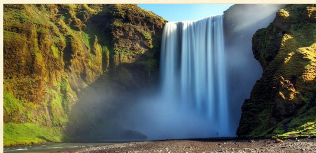
▲ 斯科加瀑布(森林瀑布)