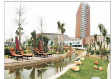
佰翔圓山溫泉酒店