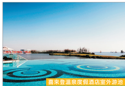
喜來登溫泉度假酒店室外游池