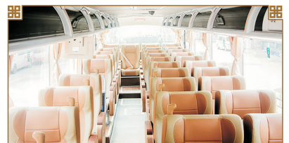
皮座椅商務旅遊車