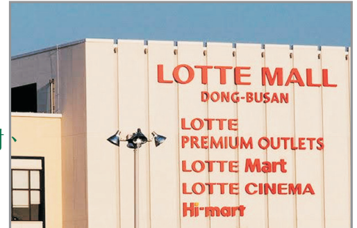
Lotte Premium Outlets