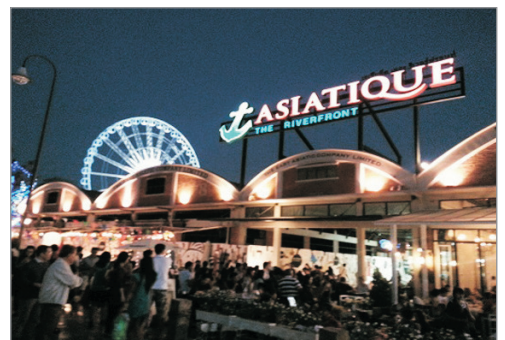
曼谷夜市Asiatique The Riverfront

曼谷—全日自由活動(包全日 DAY PASS 曼谷架空列車BTS無限次車票)【在專業導遊指導下前往如: Siam Paragon 購物廣場、Terminal 21、Siam Square One購物商場—Sanrio Hello Kitty House及MBK Centre 等各至新至潮熱點盡享購物樂趣】