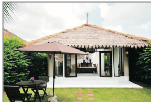
Dhevan Dara Resort & Spa