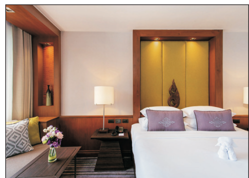
The Sukosol Bangkok Hotel