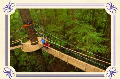
紅木樹林空中健步行 (包門票)

▶ 參觀形狀千奇百怪的石灰岩鐘乳石洞，然後乘坐小遊覽船摸黑在螢光蟲洞內漫遊，欣賞著名藍色螢火蟲，點點蟲光恍如黑夜中閃爍的繁星，難忘體驗。