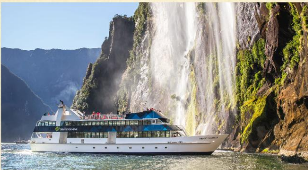
▲ 美福灣大自然之旅(自費參加)

皇后鎮▶全日自由活動(貴賓可自行漫遊小鎮感受南阿爾卑斯山脈下的恬靜氛圍，或自費參加美福灣大自然之旅一天遊，詳情可參閱新西蘭「自費項目表」) Queenstown▶Whole Day Free For Leisure • 皇后鎮：座落在新西蘭第三大湖畔瓦卡蒂普湖岸邊，背靠卓越山脈，四周環山，風光如畫。因地理環境關係，各式各樣刺激活動盡在此。這個小鎮亦是通往風光冠絕新西蘭的美福灣重要關口，可選乘觀光巴士或飛機前往，湖光山色美不勝收。