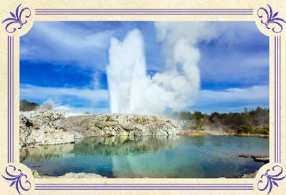
蒂普瓦毛利文化及地熱保護區

▶ 乘坐登山纜車到達600米高的博士峰山頂，於被選為世界最佳景觀的餐廳一邊享用自助午餐，一邊飽覽有「世外桃源」美譽之稱的皇后鎮湖光山色美景。