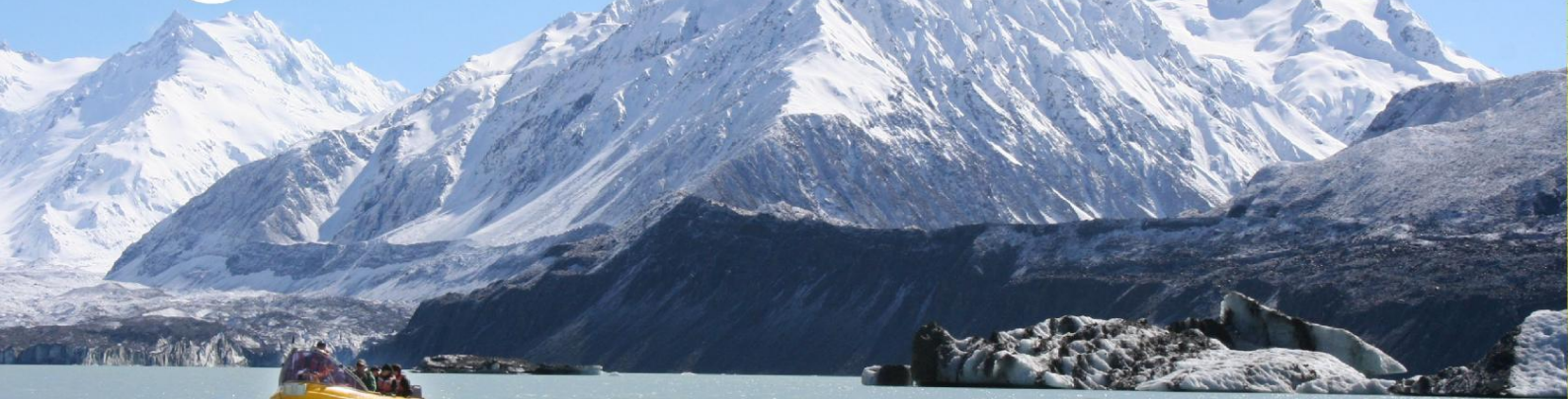
▲ 塔斯曼冰河船之旅