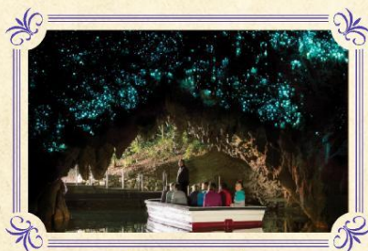
懷托摩鐘乳石及螢火蟲洞

▶ 蒂普瓦毛利文化及地熱保護區坐落於羅托魯亞城市的邊緣，佔地面積達70公頃，蒂普瓦擁有舉世聞名的間歇噴泉、地熱溫泉、矽質岩層等，遊客亦可在這裡親身深入了解新西蘭原住民～毛利族人的悠久歷史、傳統文化及習俗。