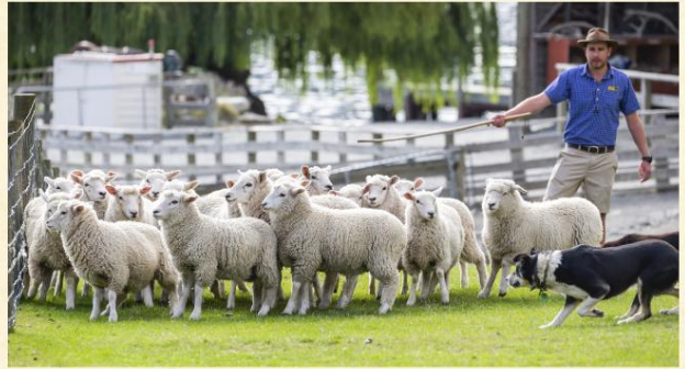
▲ 瓦爾特峰高原牧場

皇后鎮▶厄恩斯勞號百年蒸汽船、瓦爾特峰高原牧場(觀賞剪羊毛表演及享用豐富BBQ午餐)▶下午自由活動(可自費參加本公司領隊代安排之活動，詳情參閱新西蘭「自費項目表」) Queenstown▶TSS Earnslaw Cruises▶Farm Show▶Afternoon Free For Leisure▶Queenstown