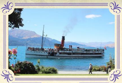
厄恩斯勞號百年蒸汽船

▶ 專業導賞員帶領您使用專業的天文望遠鏡觀賞迷人的銀河系及探索壯麗南部天空的不同元素，並由華籍專業導賞員為您解說天文知識，以雷射光導引觀賞。貴賓更可透過不同類型的天文望遠鏡觀看燦爛的星空，美麗得令人感動。