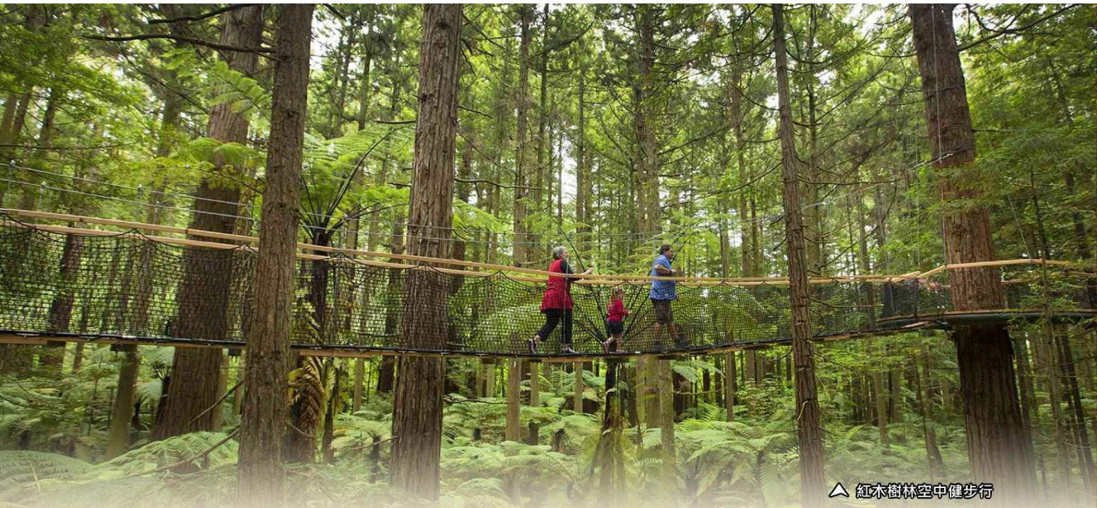
△ 紅木樹林空中健步行