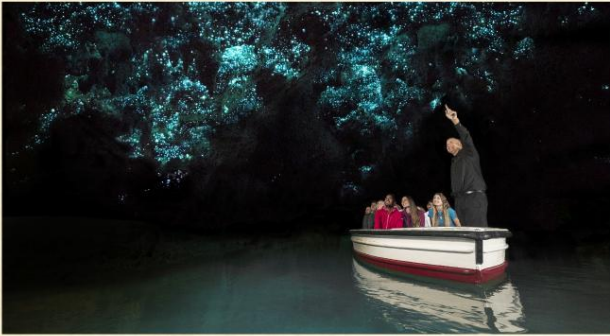
▲ 懷托摩鐘乳石及螢火蟲洞

羅托魯亞▶蒂普瓦毛利文化及地熱保護區▶鹿產品廠〈每位貴賓均可獲贈鹿茸花蜜一瓶(備註17)〉▶懷托摩鐘乳石洞及螢火蟲洞(世界自然奇景) ▶奧克蘭 Rotorua▶Te Puiā▶Deer Shop▶Waitomo Glow Worm Cave▶Auckland