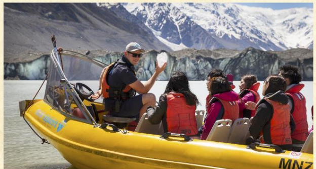
▲ 塔斯曼冰河船之旅