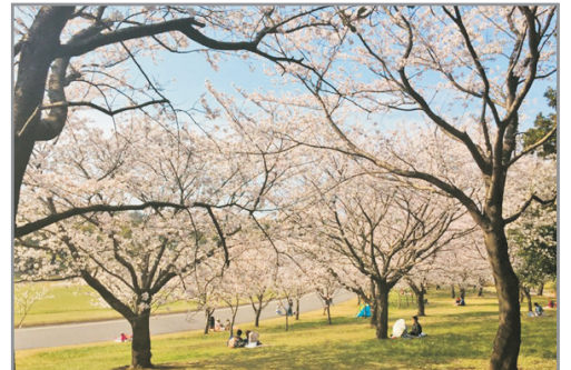
《春日賞櫻》增遊吉野公園 (3月20日至4月10日出發適用)(註4)