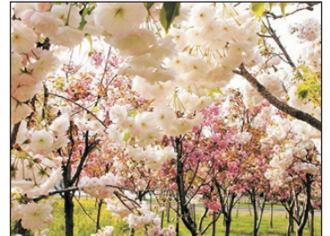
鳳凰溝參考賞花期(註23)

Day 5 南昌—江南三大名樓~滕王閣(遊覽時間約1.5小時)—車遊八一廣場、八一起義紀念碑—南昌→香港