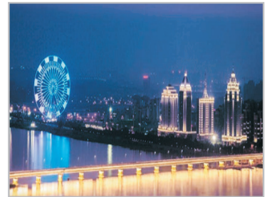
秋水廣場南昌之星

香港→南昌—秋水廣場、遠眺南昌之星摩天輪(遊覽時間約1小時) ~秋水廣場：位於贛江之濱，與滕王閣隔江相望，是一座以噴泉為主題的大型休閒廣場，當中廣場晚上音樂燈光噴泉最為著名。