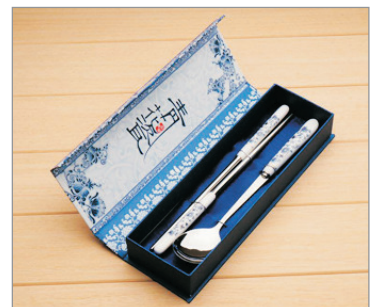
【精美紀念品】 景德鎮青花瓷餐具(每位一套)

婺源—景德鎮—古窯瓷廠【觀賞陶瓷製作過程】(遊覽時間約1.5小時)—陶瓷博物館#(遊覽時間約30分鐘)—南昌 ~陶瓷博物館：藏有三萬六千餘件來自新石器時代陶器和漢唐以來各個不同歷史時期的陶瓷名品佳作，其中珍貴的文物涵括了景德鎮千年制瓷歷史長河中的代表品種。特別是王步、珠山八友等近現代藝術陶瓷精品，集中國古瓷之精華，彙天下名瓷之大成，全面展示古今中外的陶瓷文化。 #陶瓷博物館逢星期一休館或如遇休館，將改為參觀陶瓷一條街。 *婺源至景德鎮，車程約1.5小時。*景德鎮至南昌，車程約2.5小時。