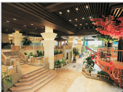
王朝聖地溫泉酒店