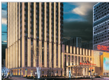
丹東萬達嘉華酒店