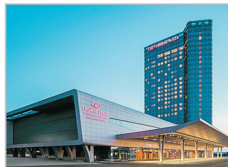
大連皇冠假日酒店