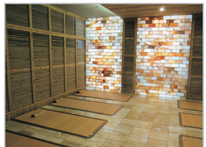
金茂海洋之星汗蒸休閒浴場