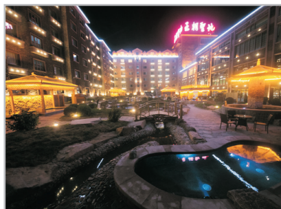
王朝聖地溫泉酒店溫泉