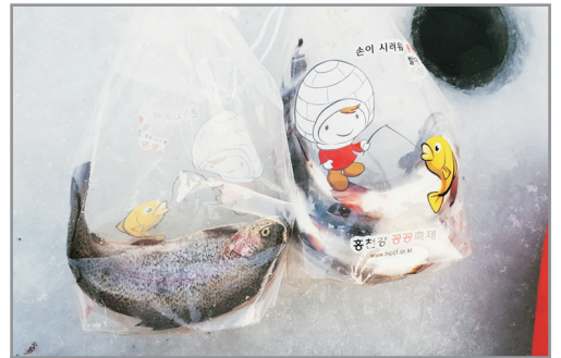
《增遊》洪川人蔘鱒魚節 (1月3日至18日出發團隊適用)