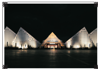
聖地天堂洲際大飯店