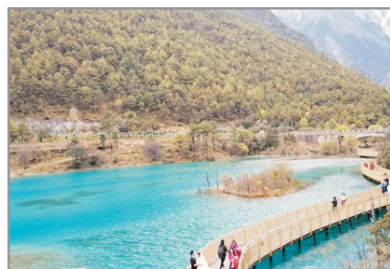
藍月谷木棧道步道

【藍月谷】這裡的水源是來自雪山冰川融化的冰雪，位於玉龍雪山腳下，晴天之下，水呈藍色，景色奇幻。而山谷呈月牙形，遠看就像一輪藍色的月亮鑲嵌在玉龍雪山腳下，因此得名藍月谷。漫步藍月谷木棧道步道，細賞迷人美景風光。