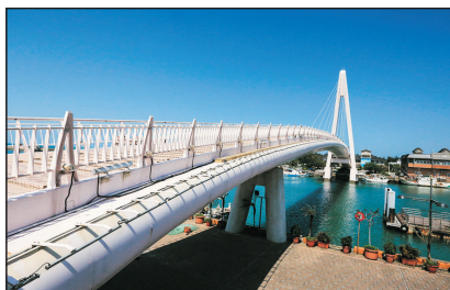
淡水漁人碼頭(台灣)