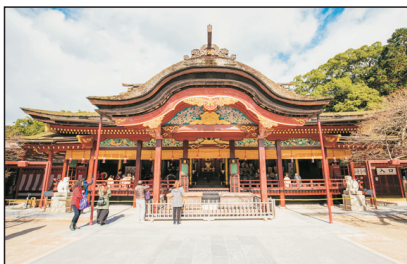
太宰府天滿宮(日本)