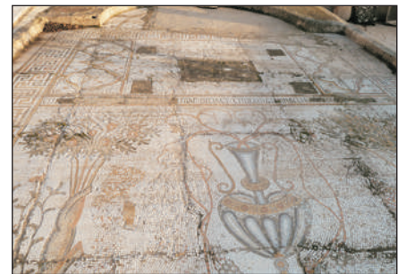
美達巴聖城馬賽克遺跡

~ 失落古城伯特拉 ：又名紅玫瑰城，因城堡泥土呈粉紅色，加上陽光照射下，斑斑紅色美麗奪目，如玫瑰紅艷驕美，始建於公元二世紀，整座城都是由岩石岩洞築成的，所以堪稱最安全的堡壘。