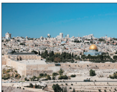
「首都聖城」 耶路撒冷

2001年被列入為「世界文化遺產」之亞克港。12世紀曾被十字軍佔領。而18世紀期間亞克港成為了典型奧圖曼帝國堡壘城市，至今仍遺留了很多富有特色的堡壘、清真寺等。