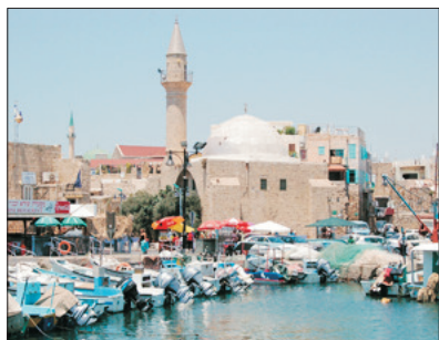
「世界文化遺產」 亞克港

2001年被列入為「世界文化遺產」之亞克港。12世紀曾被十字軍佔領。而18世紀期間亞克港成為了典型奧圖曼帝國堡壘城市，至今仍遺留了很多富有特色的堡壘、清真寺等。