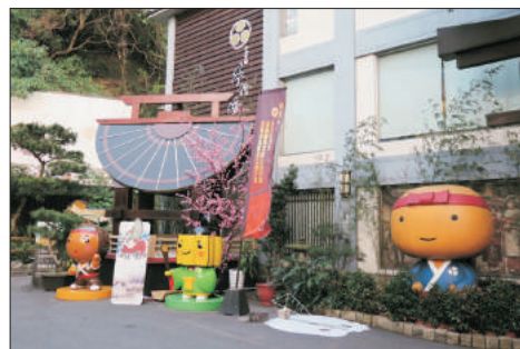
手信坊創意和菓子文化館