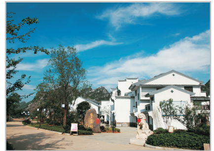
桃花江畔魯家新村

#如香港前往桂林之直達列車滿座或因應行程安排，或需要於深圳北站或廣州南 站轉乘和諧號前往桂林北站，有關安排將由領隊於出發前通知，客人不能藉此 要求退出或要求賠償。