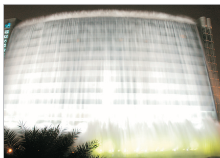
桂林灕江大瀑布酒店