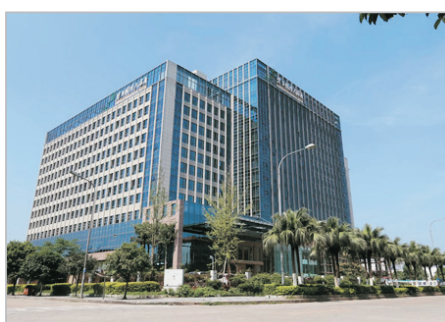
桂林碧玉國際大酒店