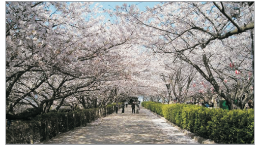
《增遊賞櫻》戰場原公園， 欣賞約400株櫻花盛放。 (3月25日至4月5日出發適用)(註2)

秋芳洞、角島大橋、元乃隅稻成神社、門司港、 關門海峽行人隧道、宇佐神宮、杵築城下町散策、 金鱗湖、湯布院懷舊溫泉街、九醉溪(九重夢吊橋)、 鳥栖Premium Outlets、海之中道海濱公園、天神地下街 《2020年3月1日起出發適用》