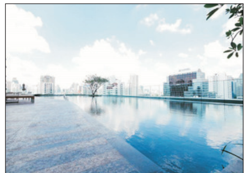
Grande Centre Point~Sukhumvit 55