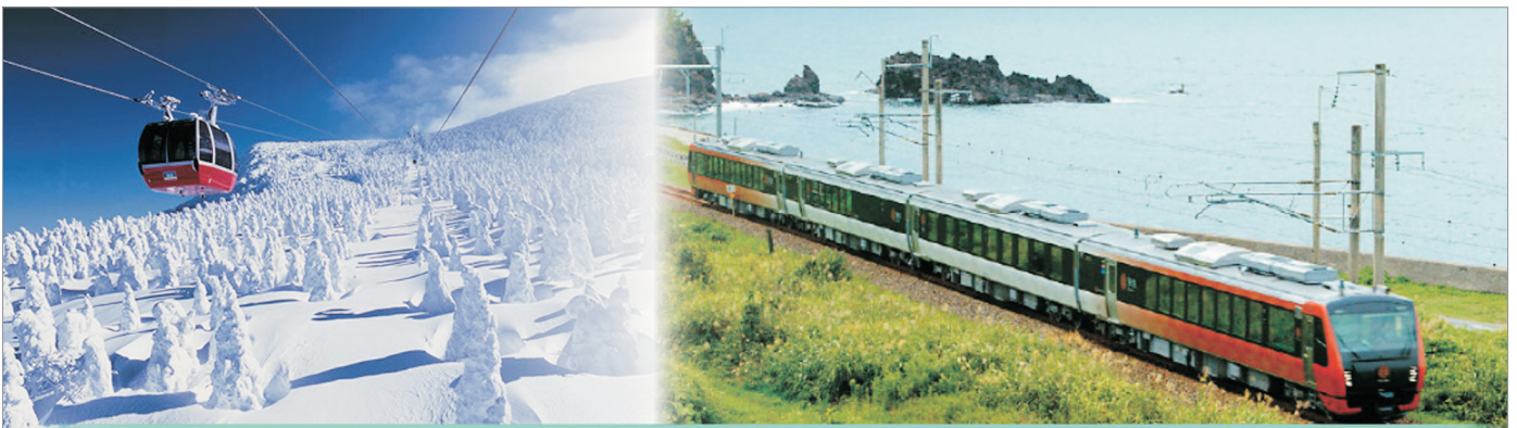
一次過全體驗 ~ 觀光列車、藏王纜車賞樹冰、雪洞祭、鐵道絕景

湯西川雪國體驗~Kamakura雪洞祭、特色觀光列車~海里、銀山溫泉古街散策、藏王高原~藏王樹冰、第一只見川橋梁(遠眺)、東照宮、會津鶴城、山居倉庫、松島乘遊船、彌彥神社、新潟米菓子王國、諏訪田製作見學、Aeon Mall 購物城 《只辦一團：2月21日限定出發》