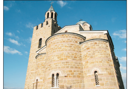
維力高塔盧夫城堡

12天團及16天團及13天團及17天團須視乎團隊人數而可能合併出發，凡參加12/13天團之團友於第11/12天早餐後，於指定時間集合，本公司派出華籍職員及專車送往機場，自行辦理登機手續。