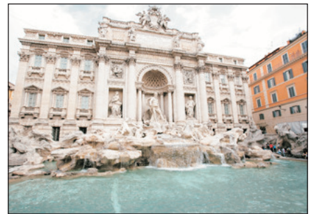
德維雷噴泉(許願泉)

· 比薩斜塔 ：各團友可由領隊安排自費前往比薩。比薩是佛羅倫斯旁邊的一個小城市，但卻因為一座「失敗的建築」而聞名於世，那就是世界七大奇觀之一的「比薩斜塔」。比薩斜塔其實是比薩教堂(Duomo)的一部份，斜塔呈圓柱形，共有八層，大鐘給放置在頂層上。各層都以優美的柱子環繞著，但只是用作裝飾，沒有支撐的功效，真正的支撐是內層厚實的牆壁。