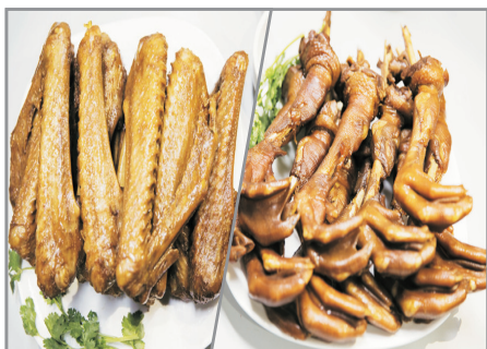
比翼雙飛獅頭鵝宴