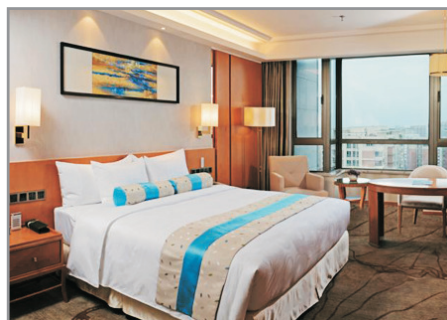
汕頭澄海猛獅凱萊酒店