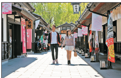
櫻之小路(熊本，日本)