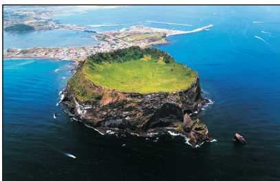
城山日出峰(濟州，韓國)