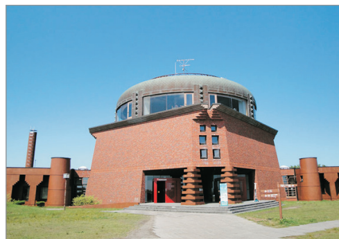
釧路市濕原展望台