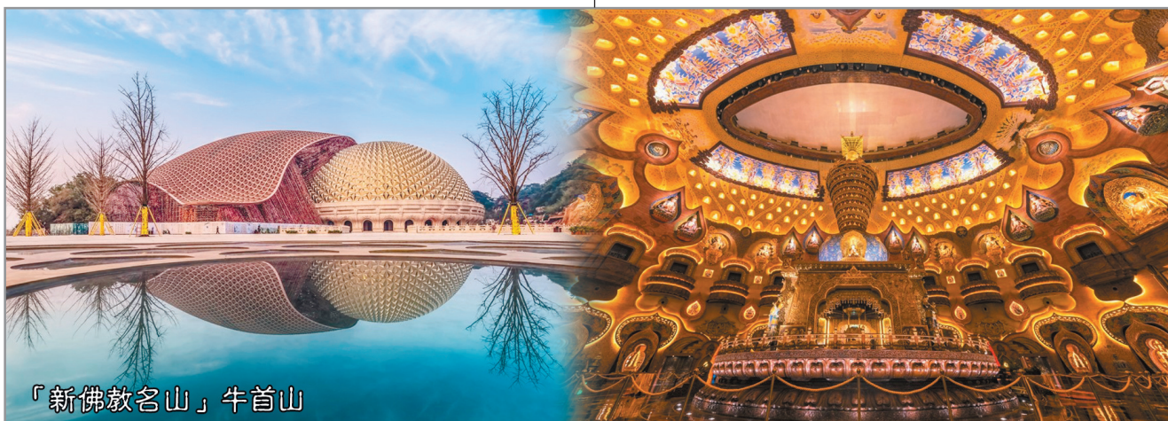
「新佛教名山」牛首山

牛首山佛頂聖境耗資70億打造，其中之佛頂宮建築莊嚴祥和，不論外牆、門檻抑或天花均滿佈雕刻，設計巧奪天工。佛頂宮內建有一座臥佛，其造型借鑑於敦煌莫高窟中的臥佛塑像，面容莊嚴而慈祥，並會360度緩慢地旋轉，寓意佛法恩澤四方。而位於地下五層深之千佛舍利地宮，由宮外長廊至宮內均金碧輝煌，華麗非凡。