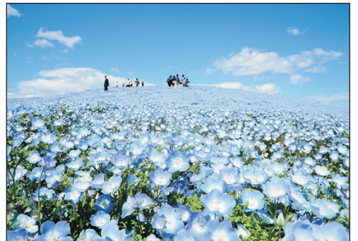
日立海濱公園粉蝶花