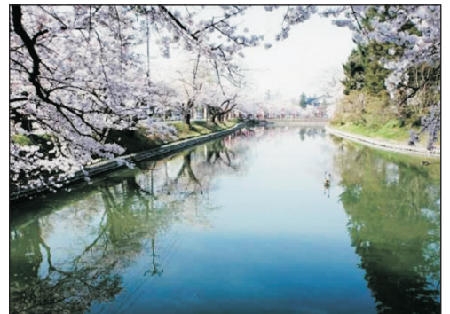
「賞櫻名所」最上公園