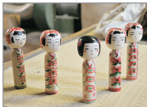
DIY傳統木芥子人形娃娃體驗