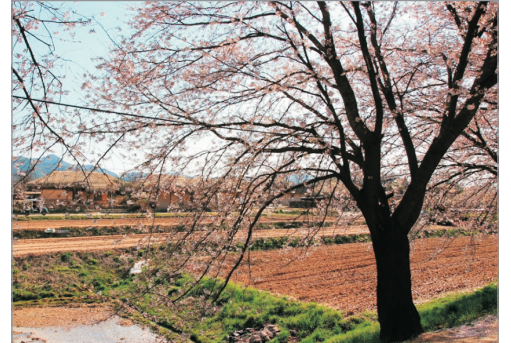
「UNESCO世界文化遺產」安東河回村