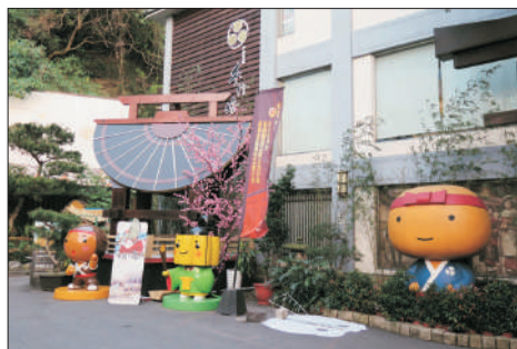
手信坊創意和菓子文化館