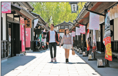
櫻之小路(熊本，日本)