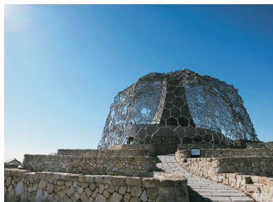
六甲垂枝展望台(神戶)