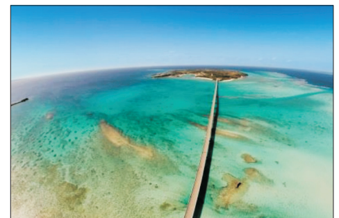
池間大橋(宮古島, 日本)