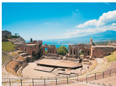
陶納米山城(麥西娜，西西里島)