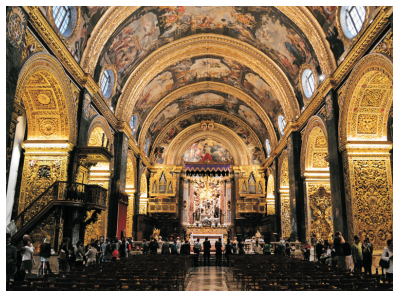
聖約翰教堂(馬耳他)