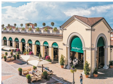
Serravalle Designer Outlet