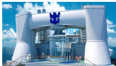
Ripcord by iFly海上跳傘體驗 ® *