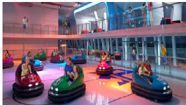
SeaPlex海上多功能運動場*