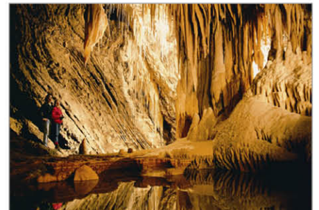
莫爾溪克斯國家公園