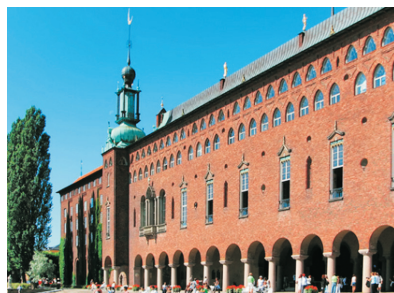
斯德哥爾摩市政廳