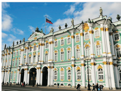
隱士盧博物館(冬宮)