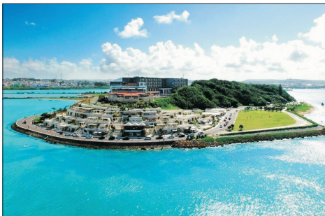
Umikaji Terrace 瀨長島海風露台(沖繩，日本)