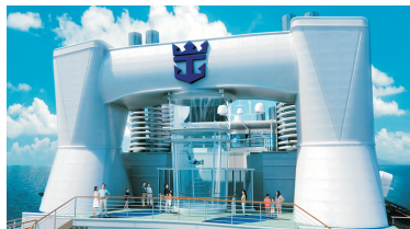
Ripcord by iFly海上跳傘體驗®*