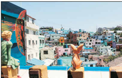
甘川洞文化村(釜山，韓國)