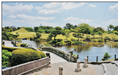
水前寺公園(熊本，日本)