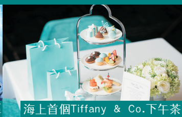
海上首個Tiffany & Co.下午茶