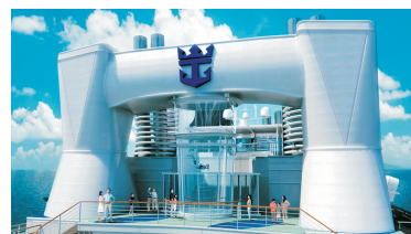
Ripcord by iFly海上跳傘體驗®*