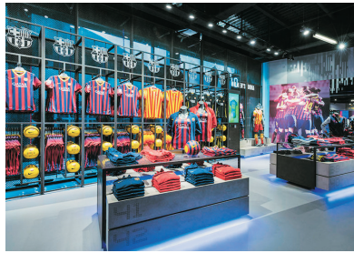
巴塞隆那球會紀念品專門店 (西班牙)