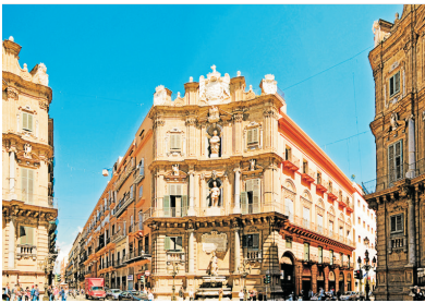
四首歌廣場(巴勒摩，西西里島)