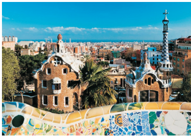
「世界文化遺產」奎爾公園 (巴塞隆那)