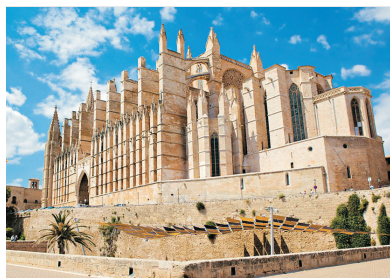
帕爾馬大教堂(西班牙)